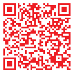
全通事務處理 全台徵求場所查詢

註：以上資料係屬彙總資料，股東如須查詢詳細資料請上證基會網站(https://free.sfi.org.tw/)查詢。